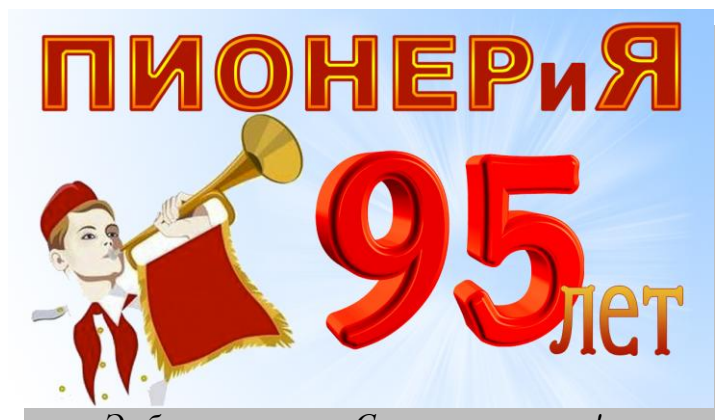
Эмблема квеста «Салют, пионерия!»

городе Балаково, добрыми традициями тех лет, которые во многом находят продолжение в делах подрастающего поколения России.