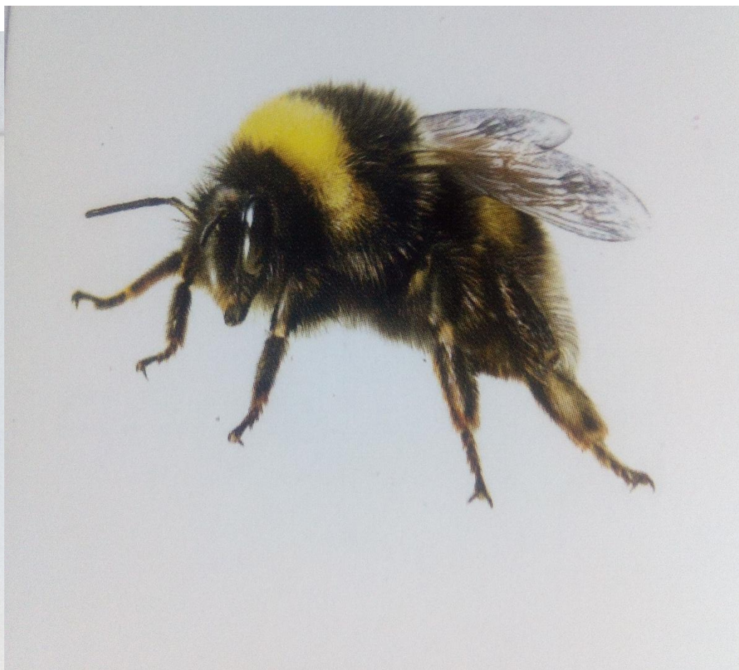
Перепончатокрылые – 4 прозрачных крылышка