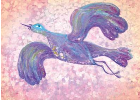
Рисунок-оберег «Птица счастья» (на счастливую семейную жизнь).