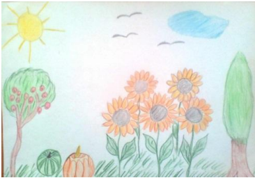
Рисунок Расим. (сделать поделку из природного материала).

Рисунок Оли. (нарисовать лабораторию селекционера.)