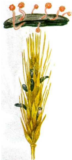
Спорынья пурпурная на колосе ржи.