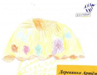
Рисунок Ани. (замесить соленое тесто и сделать из него каравай)