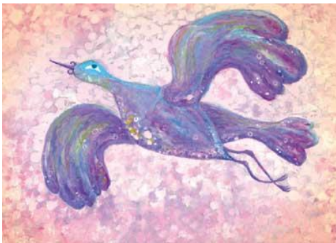
Рисунок-оберег «Птица счастья» (на счастливую семейную жизнь).