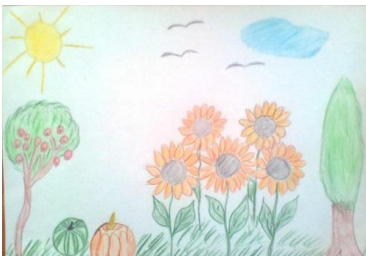
Рисунок Расим. (сделать поделку из природного материала).

Рисунок Оли. (нарисовать лабораторию селекционера.)