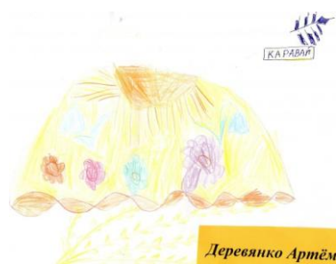
Рисунок Ани. (замесить соленое тесто и сделать из него каравай)