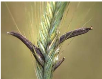
ГОЛОВНЯ , болезнь растений, вызываемая грибами.

СПОРЫНЬЯ вызывают болезнь злаков В колосьях пораженных злаков вместо зерен образуются черно-фиолетовые рожки.