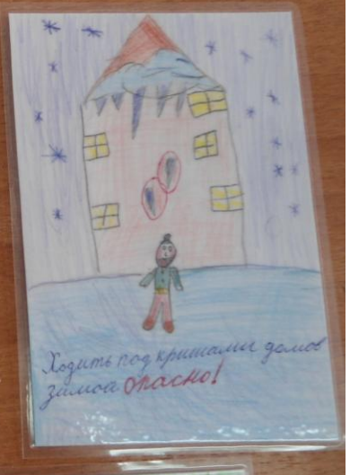
Ходить под крышами домов зимой опасно!