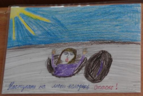
Наступать на мокрую лужу опасно!