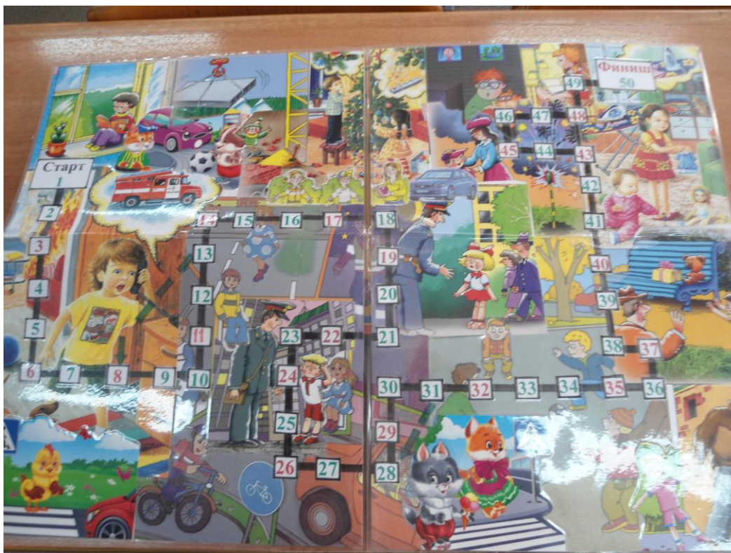
Фото 4–7: Игровые карточки с изображением опасных ситуаций.