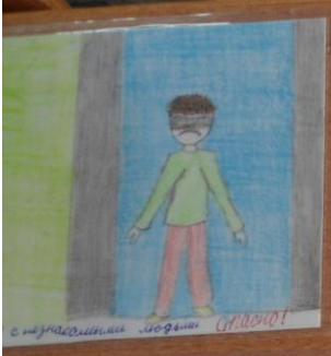
с незнающими людьми опасно!