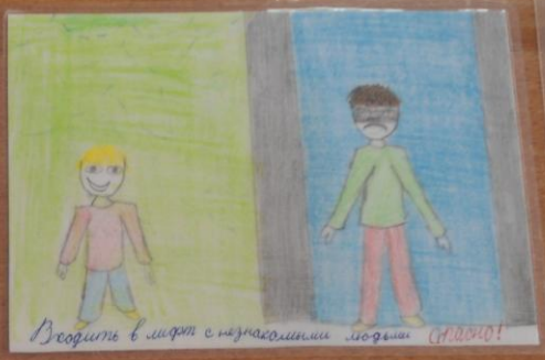
Входить в лифт с незнающими людьми опасно!