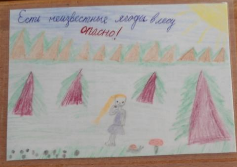
Есть неизвестные люди в лесу опасно!