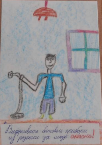
Выдергивать бытовые приборы из розетки для школы опасно!