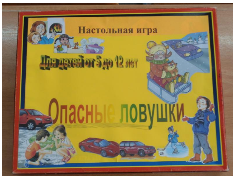
Фото 2: Комплект настольной игры «Опасные «ловушки»»: инструкция, фишки, кубик, игровое поле, карточки.

Фото 1. Результат КТД: настольная игра «Опасные «ловушки»».