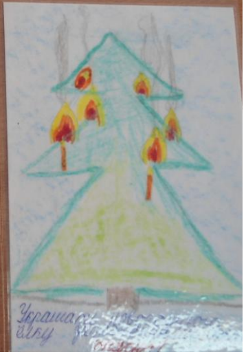
Украшать новогоднюю елку разноцветными ветками опасно!