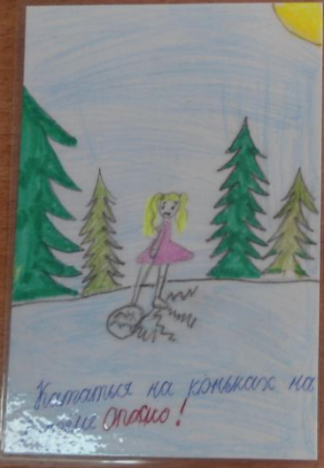
Кататься на коньках на льду опасно!