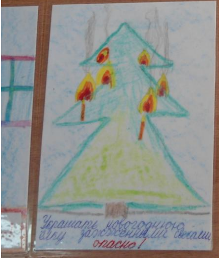
Украшать новогоднюю елку разноцветными ветками опасно!