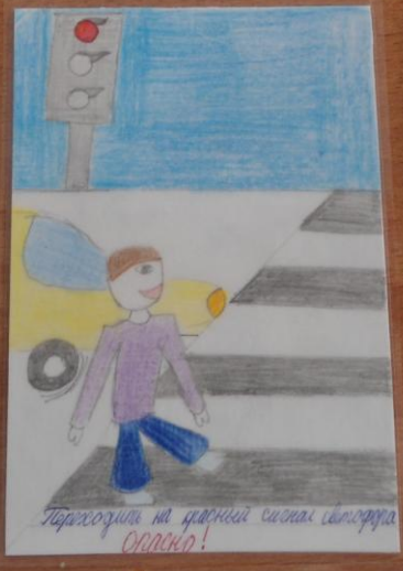
Переходить на красный сигнал светофора опасно!