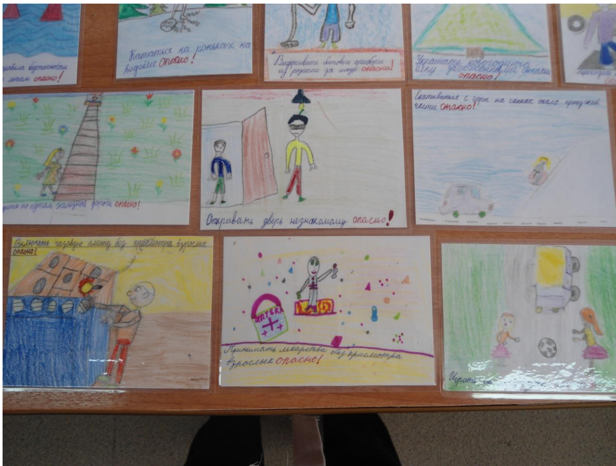
Фото 8–9: Немного теории...