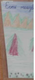
Есть неизвестные люди в лесу