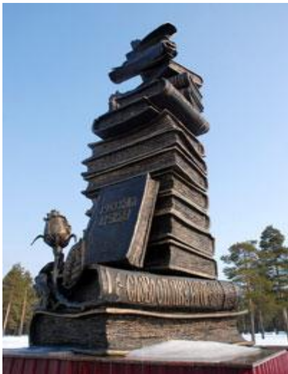
Памятник книге и печатному слову в Когалыме.