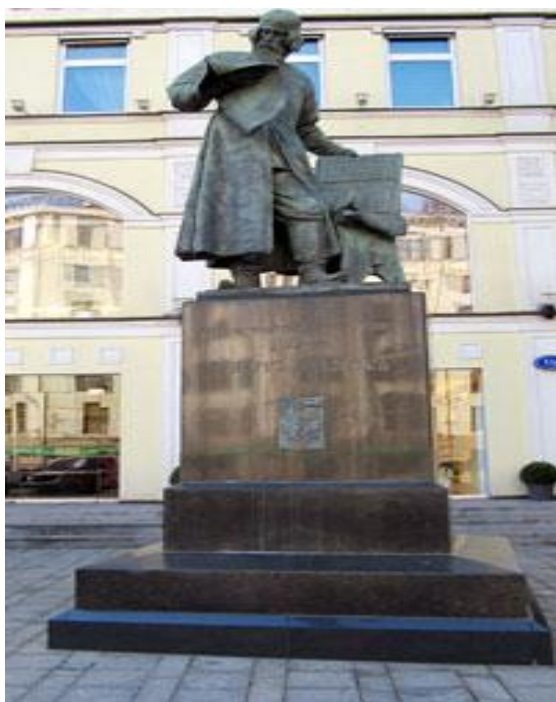
Памятник первому известному русскому книгопечатнику Ивану Фёдорову.