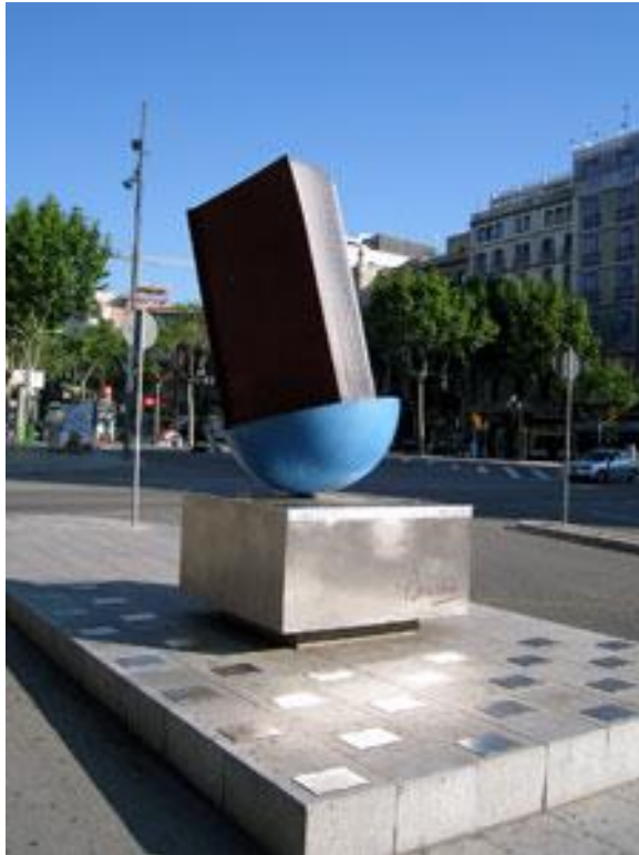
Скульптура "Памятник книге".