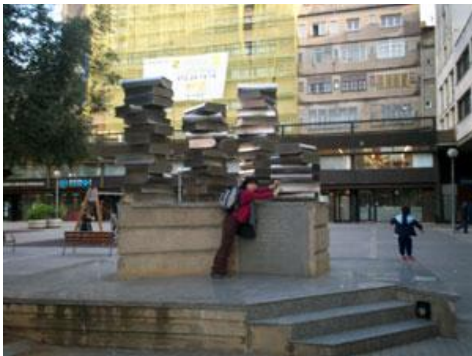
Еще больше монументальных книжек из Барселоны