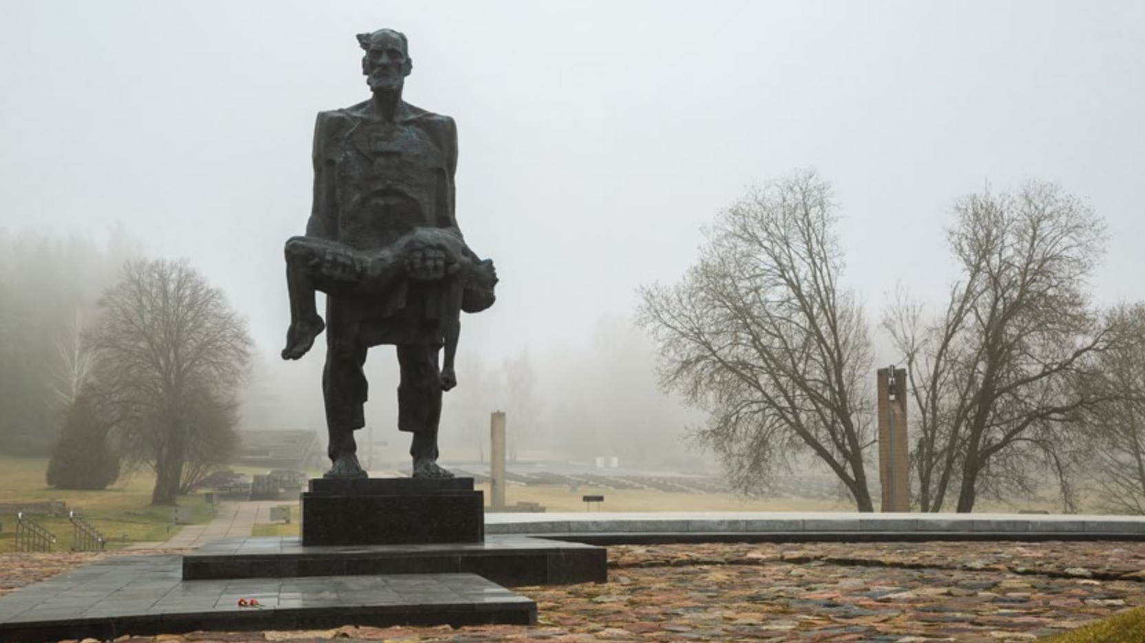
Монумент «Непокоренный человек» в Хатыни. Скульптор С.И. Селиханов