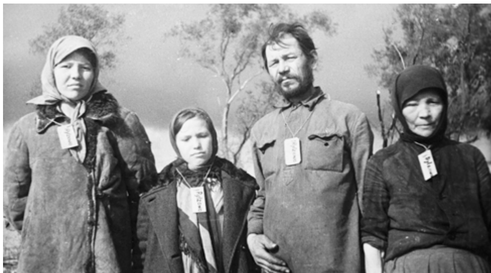
На оккупированных советских территориях фашисты обязывали жителей носить на шее бирки с названием их родной деревни

Участвовавший в этом злодеянии бывший полицейский Остап Кнап показал: «После того как все жители деревни были согнаны в сарай и заперты в нем, переводчик Лукович поджег соломенную крышу сарая. Находившиеся в нем люди стали кричать, плакать, молить о пощаде, ломиться в запертые ворота.