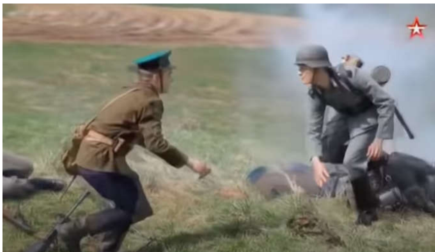
Рис. 12. Рукопашная. Реконструкции боя на участке 86 –го пограничного отряда. (Битва оружейников. Пулемёты. Фильм 8.) Скриншот. (К стр. 200).