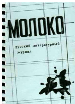
Рис.5. (к стр. 194).