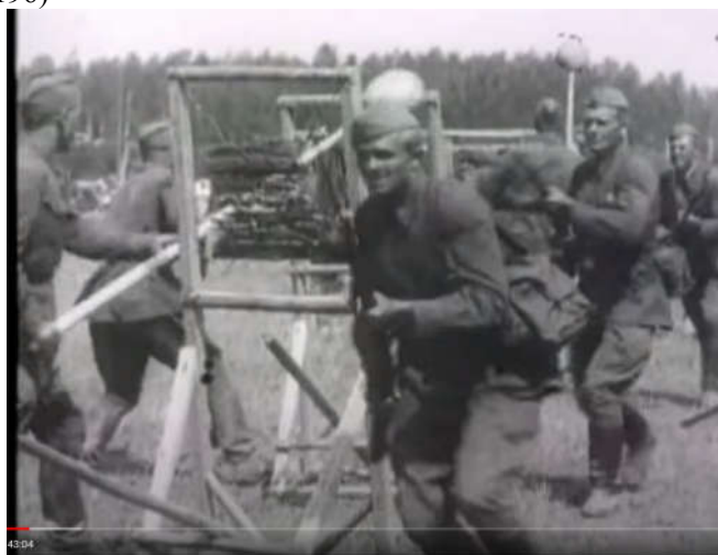
Рис. 10. Пограничники учатся штыковому бою, 1941 год. «Стоявшие насмерть», граница, начало войны, док. Фильм. Скриншот (К стр. 196)