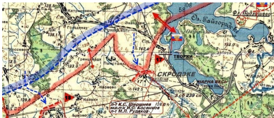
Рис.8. Карта расположения 17-ой заставы 86-го пограничного отряда со штабом в деревне Скродске. Красными линиями со стрелками обозначены границы охраняемого участка. (К стр. 196)

Рис. 7. Полковник Гурий Константинович Здорный. В начале войны командовал 86-м Августовским пограничным отрядом. За успешное освоение нового участка границы он был награждён орденом Ленина. Начальник штаба отряда капитан И. А. Янчук за хорошую организацию оперативно-служебной деятельности и боевую подготовку личного состава был награждён орденом Красной Звезды. (К стр. 196)