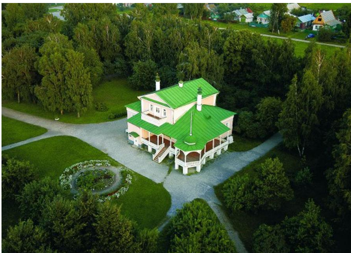
Дом родителей поэта С.А. Есенина